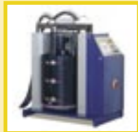
Fass-Schmelzer für 200 Liter Gebinde