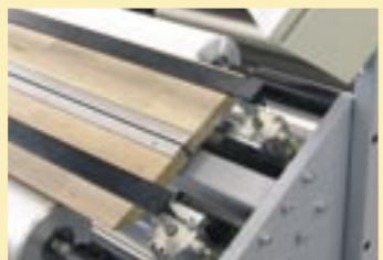
Mit der optionalen Splicestation wird die Fertigung von Endlosapplikationen mit geringem Aufwand möglich.