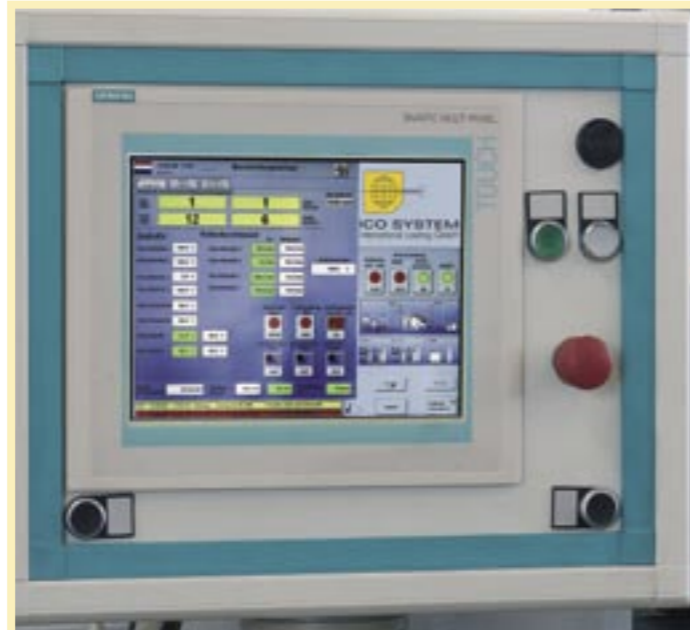
Die Anlagensteuerung erfolgt über ein Siemens Touch Panel mit grafischer Visualisierung und höchster Bediensicherheit. Prozessdaten werden über Ethernetschnittstelle in das Produktionsnetzwerk eingespeist.