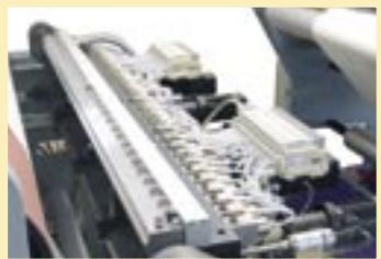
Flächenauftragskopf mit elektropneumatischer Steuerung für kontinuierlichen Auftrag. Optional mit verstellbarer Auftragsbreite.