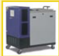
Tankgeräte von 15kg - 1000kg Schmelzvolumen